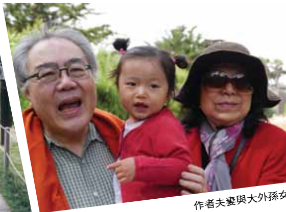
作者夫妻與大外孫女