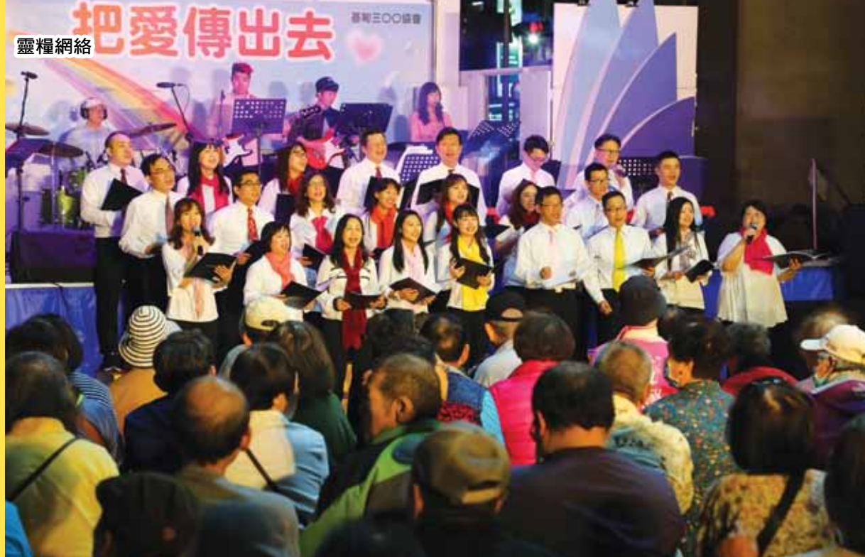
汐止火車站的逾越節佈道會——未曾看見的榮耀在汐止。