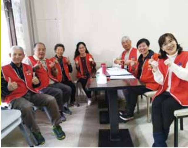
教會志工和社區志工合影。