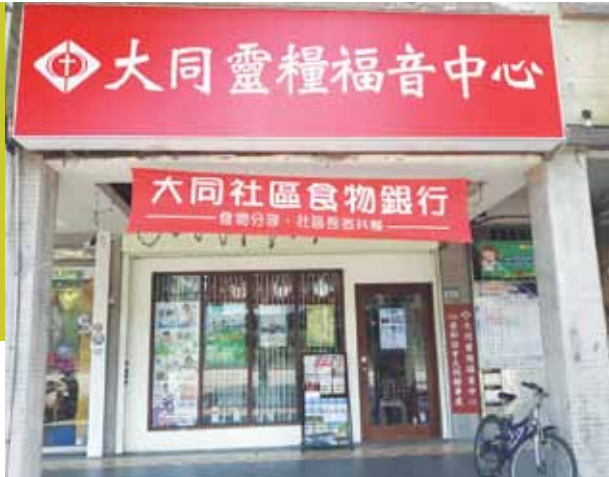
掛上紅布條，社區民眾絡繹不絕來領取物資。