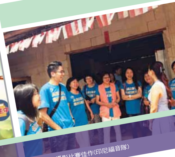
2017短宣攝影比賽佳作(印尼福音隊)