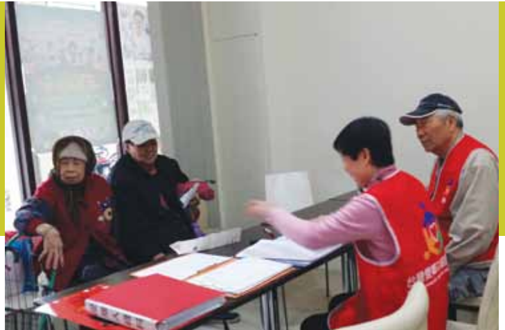
社區民眾等候領取物資。