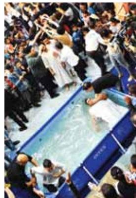
匈牙利短宣，羅姆人村莊上百人受洗。