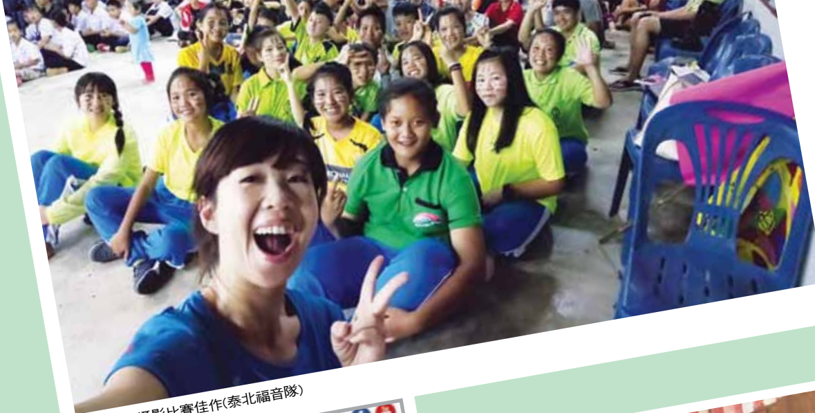
2017短宣攝影比賽佳作(泰北福音隊)