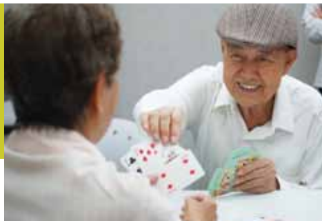
玩撲克牌不僅找回童心，還可以預防失智。