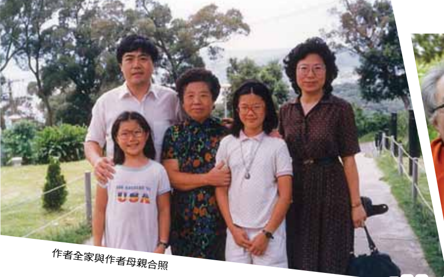
作者全家與作者母親合照