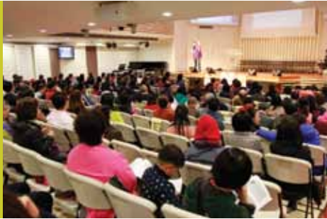
2017年債務解決有希望說明會現場。