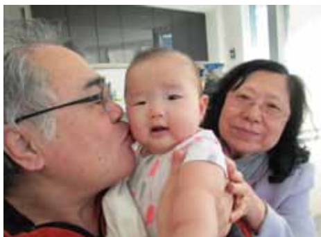
作者夫妻與小外孫女