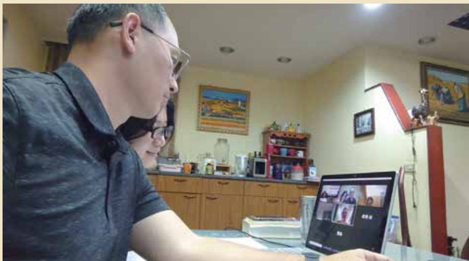
黃俊強夫妻線上小組操作

神的大能不受環境限制，短短四個月內，小組家人中有5位慕道友受洗。神快手筆的作為，真的超乎我們所求所想。