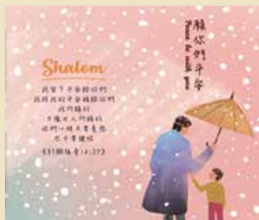
「願你們平安」福音單張

當新聞開始出現新冠肺炎消息，教會就有警覺，當國內出現第一起境外移入的確診案例(2020/1/21)，又考量新春年假，人潮大量南北流動，容易引發病毒擴散，我們就開始透過社群媒體、官網提醒大家勤洗手、戴口罩，並用禱告的心為疫情守望；二月份，社會氣氛緊張，製作了「願你們平安」福音單張，鼓勵大家用詩篇九十一篇為自己、家人、朋友等有需要的人禱告；同時教會也開始討論線上小組、線上崇拜的可能性；三月份，為了讓弟兄姊妹在瞬息萬變的疫情下有最新、最完整的聚會資訊，三天內於官網設立了新冠肺炎防疫專區，並在小組長季會中報告線上小組聚會方式，全面推行線上小組，主日崇拜也改為直播與實體聚會雙軌並行；3/24教會宣布從3/27起暫停所