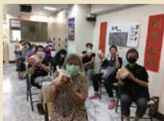
弱勢族群長輩領取物資