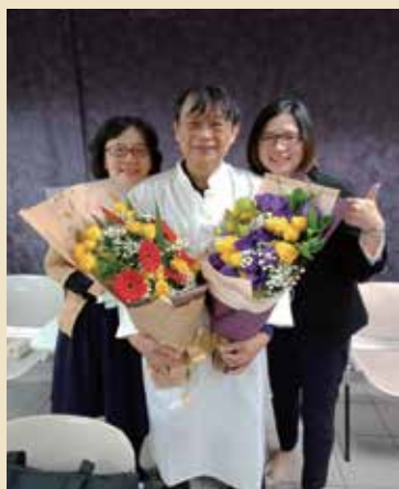
今年2月小組成員受洗照

今年一月新冠肺炎疫情開始蔓延，過年後我們依然採取實體小組聚會，因應疫情在聚會時全程戴口罩，小組聚會取消點心供應，但弟兄姊妹依然踴躍參加小組聚會。奇妙的是在疫情嚴峻的二、三月，神又陸續帶領5位新朋友到我們小組，甚至有一位新加入的姊妹第一次和大家見面就是在線上，但因我有事先私下邀約這位新朋友出來見面彼此認識，也簡介我們小組的成員讓她有初步的了解，希望可以幫助她快一點融入我們當中，果然，她真的很快地就融入我們。