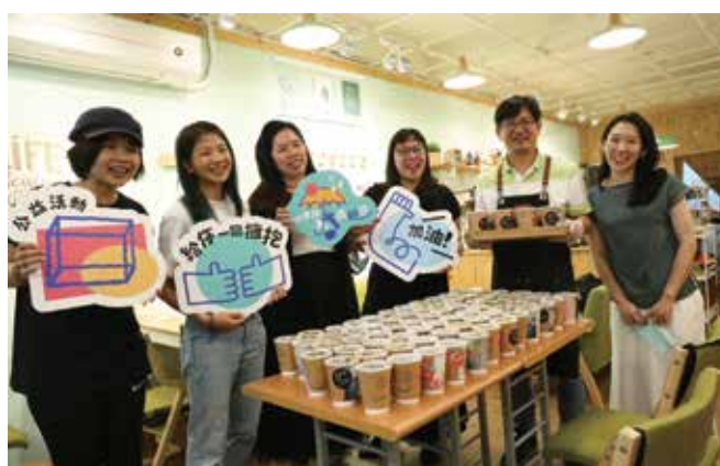
肯亞短宣的Super Team參與「小店老闆我挺你」行動，探訪和關懷店家。