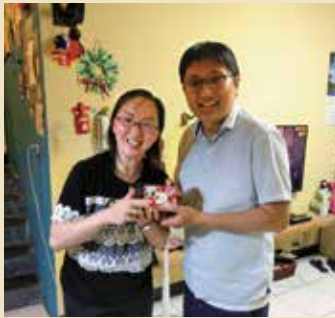
小組長發送母親節禮物