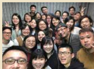
充滿宣教熱情的旅者小組