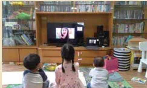
會友在家收看兒童主日學

恢復實體聚會之後，現階段福音中心仍保留有直播崇拜，可以服事到偶爾因為個人因素無法參加聚會的弟兄姊妹，「當我們有直播的崇拜，對這些無法到場的弟兄姊妹而言，就很像還是跟我們在一起。」