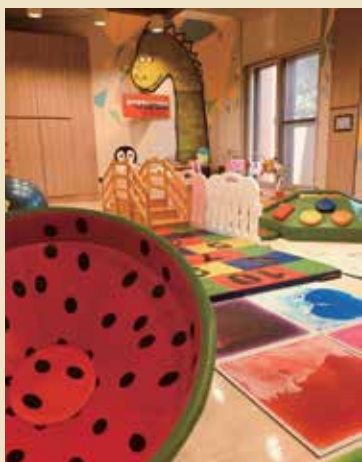
KC館彩繪牆壁換新裝