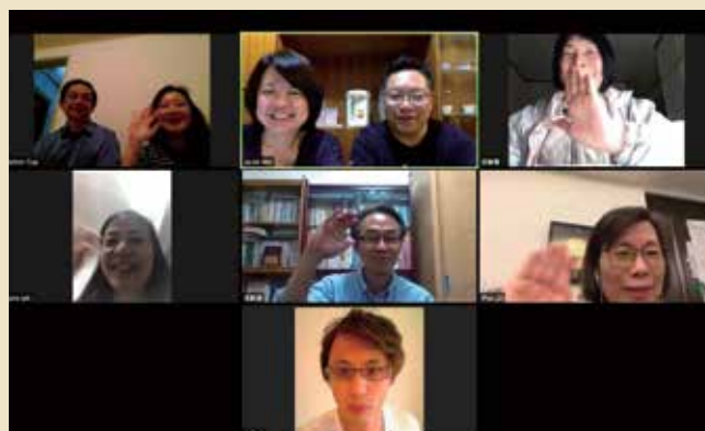
越來越熟練的線上小組聚會

因著新冠肺炎疫情的蔓延，感受到上帝的作為奇妙可畏，藉著網路聚會，神要帶領教會走上一個新的趨勢、發展新的事工，使福音遍傳。願神成就祂的工作！