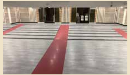
宣教大樓會堂地板更新