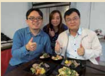
永和靈糧福音中心 小店老闆