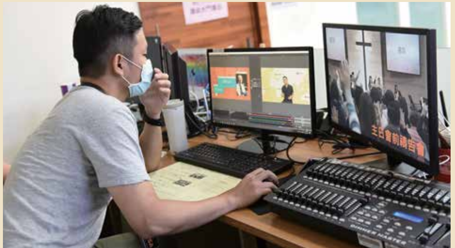
大坪林靈糧福音中心 youtube直播設定