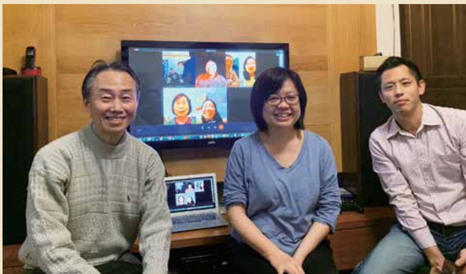
2月7日小組第一次的線上聚會

編按：新冠疫情衝擊下，小組聚會從線下轉為線上，因著年齡層不同，在轉換學習、嘗試調整及應變過程中，面臨各樣狀況和挑戰，各牧區小組如何克服困難、彼此建造，並發揮創意，帶來突破和提升呢？