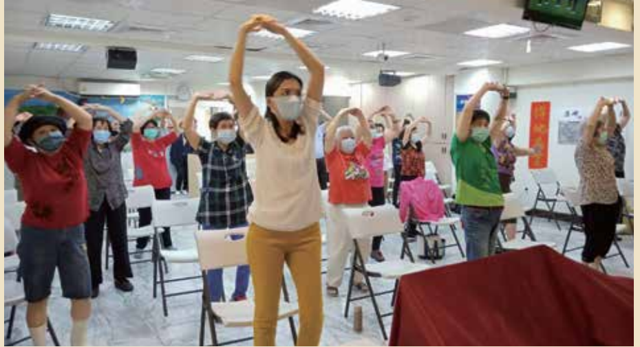
恢復實體聚會，長輩們開心地做運動。

當疫情來勢洶洶，看似一切都暫停的時候，教會的腳步並未停止；許多福音中心也在這段期間發展出各自的特色，展現了福音動能。