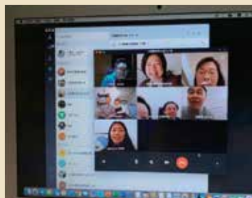
線上和實體並行的小組聚會

後來的幾週，我們採實體和線上同步進行的方式，讓大家自由選擇，結果是主要帶敬拜和話語的同工為了方便來到開放家庭，而其他組員則在線上，因為連線的帳號減少了，Line的視訊效果也比較好一些。3月開始我們改用會議軟體Zoom，詩歌敬拜的影像和音效都提升不少。3月底，隨著疫情升溫、