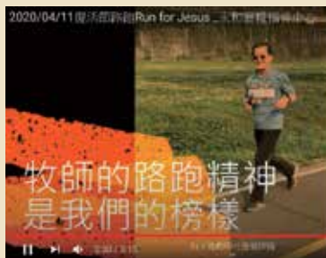
永和靈糧福音中心 發展新媒體事工

「由於目前新冠肺炎疫情尚未明顯趨緩，經謹慎評估後決定，在政府政策未改變前，本堂將繼續全面線上聚會，停止實體聚會……」