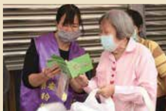
教導使用防疫滿福寶

五月底疫情漸漸趨緩，終於恢復了實體聚會，但是許多會友仍因為家庭因素、或是種種健康層面的考量無法回來，因此「虛實並進」就成為雙園福音中心接下來的目標，文茂浩牧師分享到，這段期間累積的種種應變經驗，讓教會與會友一起成長，不僅在數位化方面技能提升，在社區也收穫了更多的信任度，讓教會真正能成為地方的祝福。